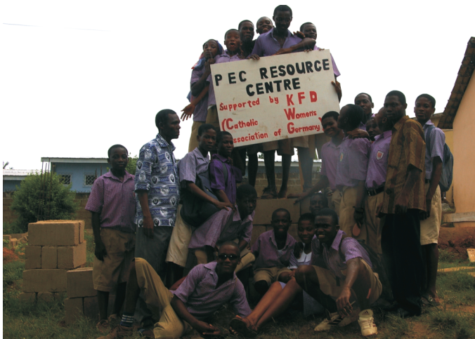
Der Grundstock ist gelegt!

Die meisten Schüler kommen aus armen Farmerfamilien der umliegenden Dörfer. Der Schulbesuch ist kostenpflichtig, doch nicht alle Eltern sind in der Lage das Schulgeld (ca. 100 Euro im Jahr) zu bezahlen. Nur jedes dritte Kind kann sich die notwendigen Schulbücher leisten und doch schaffen viele den Sprung auf weiterführende Schulen. Was an Materiellem fehlt, wird durch Lerneifer wettgemacht!